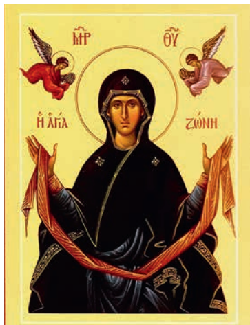
Ikône de la Très Sainte Mère de Dieu à la Ceinture miraculeuse