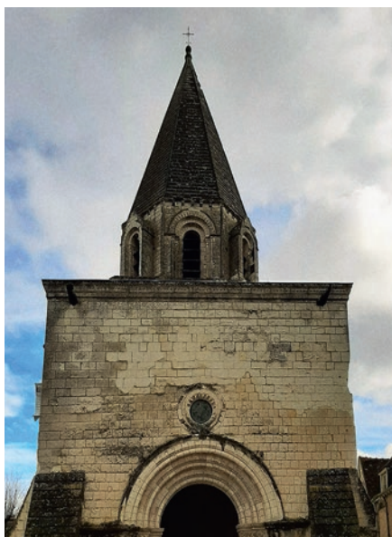
Храм св. Урсиния в местечке Лош, долина Луары