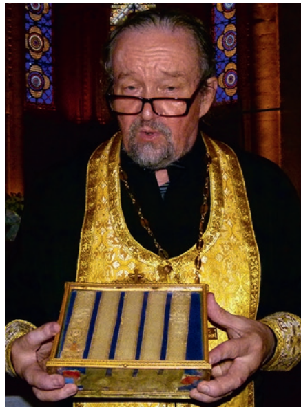
Поклонение Поясу Пресвятой Богородицы, 2018 г.

рождение наследника у бездетной императрицы Евгении, супруги императора Наполеона III.